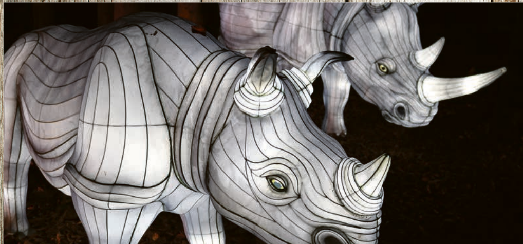
Zoo-Lights: abendlicher Spaziergang im Zoo Osnabrück