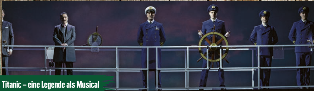
Titanic – eine Legende als Musical

Bei dem Projekt Marktzeitung mit einer Gesamtauflage von über 6 Millionen Exemplaren handelt es sich um ein marktbezogenes individuelles Printprodukt für selbstständige EDEKA-Kaufleute.